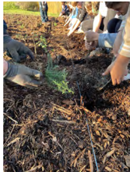
Plantations avec les élèves du collège Jean-Monnet et de l'école primaire de Montierchaume

Des compléments de plants ont également été réalisés pour remplacer des arbres issus de projets aidés sur des précédentes opérations.