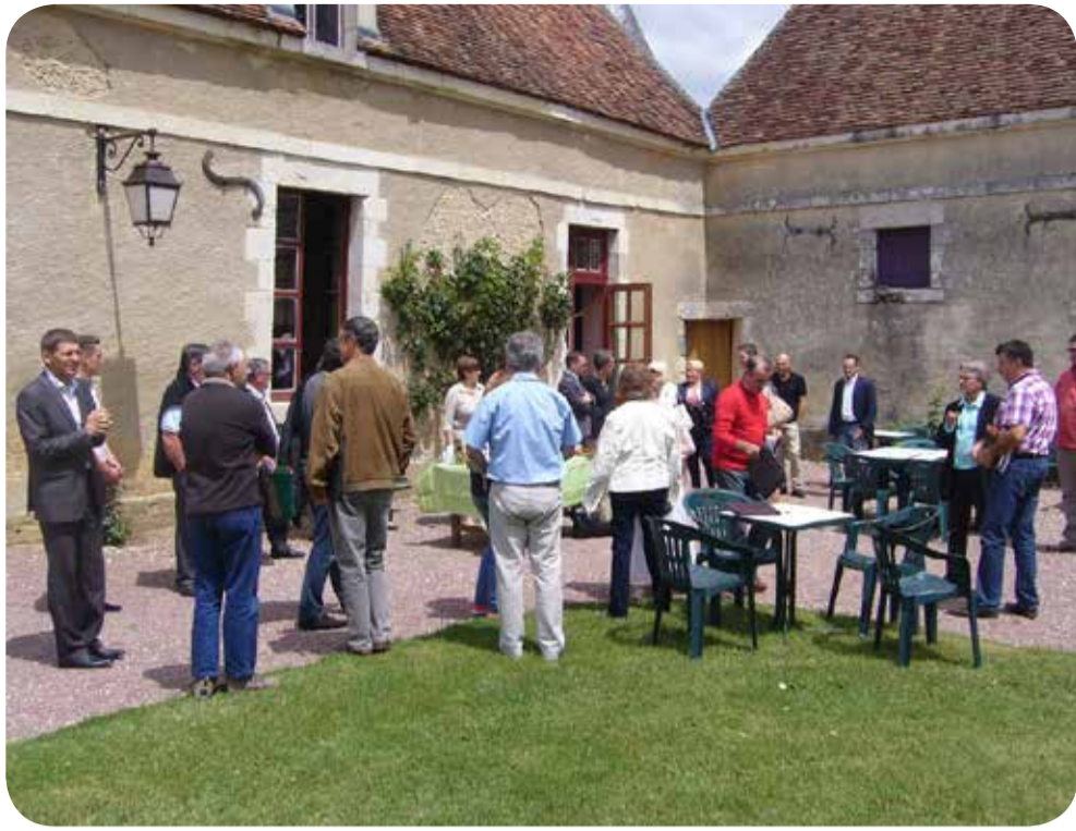
Pose café dans la cours du château