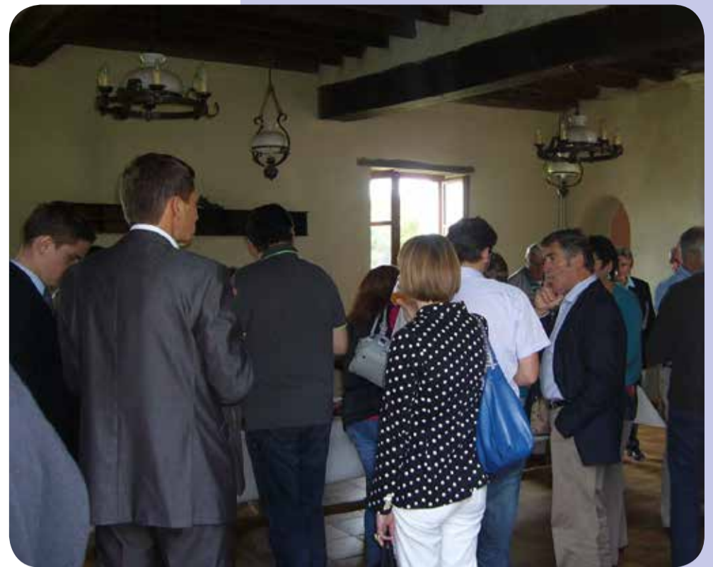
Buffet de produits locaux