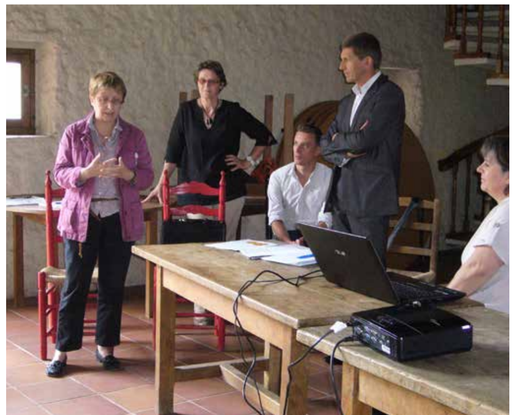
Réunion d'information du 7 juillet au Château d'Argy

“ le Pays a vocation à instaurer la solidarité entre espaces ruraux et urbains, en tant que coordinateur des intercommunalités et des acteurs de la société civile par le biais du conseil de développement. ”