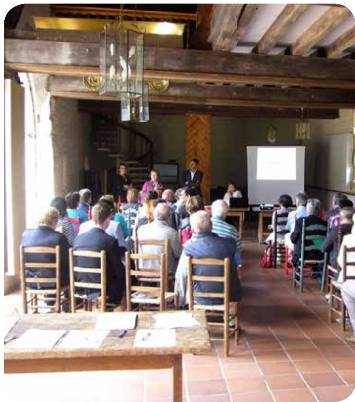
Réunion au Château d'Argy

Ce diagnostic territorial approfondi (DTA) a été réalisé en 2013. C'est un outil d'aide à la décision pour les élus et il doit servir de base à un schéma de développement qu'il faut élaborer. Ce diagnostic sera présenté au prochain comité syndical.