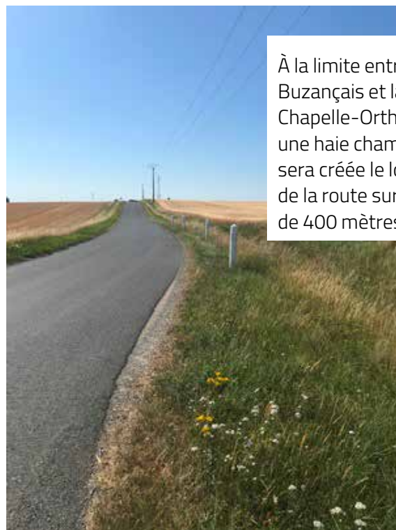
À la limite entre Buzançais et la Chapelle-Orthemale, une haie champêtre sera créée le long de la route sur près de 400 mètres.