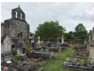
Cimetière de Vergeroux (17)

Rendez-vous le mardi 5 novembre 2019 à 14h, au niveau du parking face au cimetière, avenue du Maréchal Leclerc à Villedieu-sur-Indre (36320)