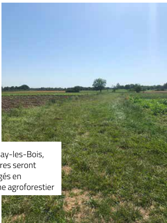
À Neuillay-les-Bois, 6 hectares seront aménagés en système agroforestier

L'agroforesterie(1) est notamment en plein essor avec des projets qui se développent en 2019 et qui se poursuivront en 2020. C'est pourquoi, nous espérons pouvoir développer des partenariats avec des écoles et des lycées pour donner à nos projets un caractère davantage pédagogique, et plus uniquement technique.