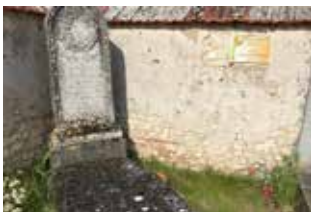
Cimetière de Villedieu-sur-Indre

Rendez-vous le vendredi 11 octobre 2019 à 14h, à la salle des fêtes située place George Sand à Reuilly (36260)